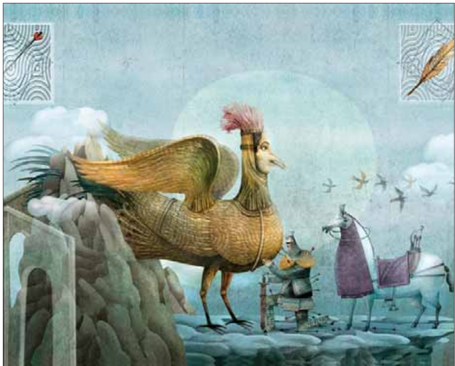
تصویرگر: یژمان رحیم‌زاده