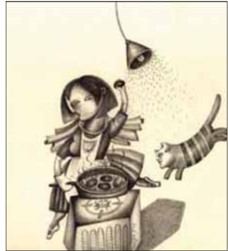
تصویرگر: نگین احتسابیان