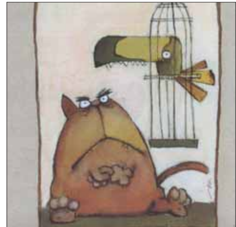
تصویرگر: حمید بهرامی

می‌توان از آن‌ها در آموزش و خلق آثار تصویری خلاق بهره گرفت.