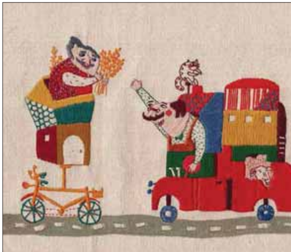
تصویرگر: سمانه مطلبی