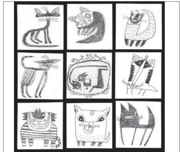
تصویرگر: محمود مختاری

در میان الگوها و تکنیک‌های متعدد پرورش خلاقیت، تکنیک بارش فکری از جمله بهترین الگوهای است که در مدت زمانی کوتاه، منجر به رسیدن به ایده‌های نو و خلاقانه می‌شود