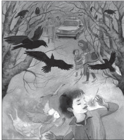
تصویرگر: مریم طباطبایی