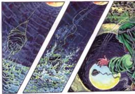
تصویرگر: نورالدین زرین کلک