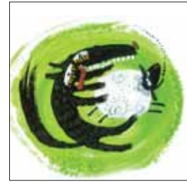
تصویرگر: راشین خیریه