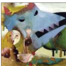
تصویرگر: کریم نصر

در زمینه آموزش این شاخه مهم گرافیکی با کمبود کتب و منابع آموزشی لازم مواجهیم و اندک کتب درسی و آموزشی موجود در زمینه این رشته، یا متون ترجمه شده‌اند و یا بیشتر به بیان تکنیک پرداخته‌اند